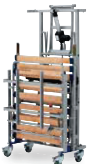
Transportsystem für belluno bibs

Untergestell auf Wunsch im Sonderlänge 1560 mm, Untergestell ab 110 cm Breite Standard 1560 mm