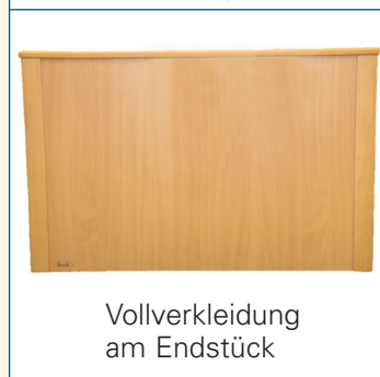
Vollverkleidung am Endstück