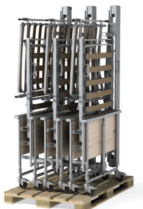
3 Betten auf einer Euro-Palette

Elektrische Verstellung von Rücken- und Beinteil zusätzlich mit automatischer Dreifachfunktion.